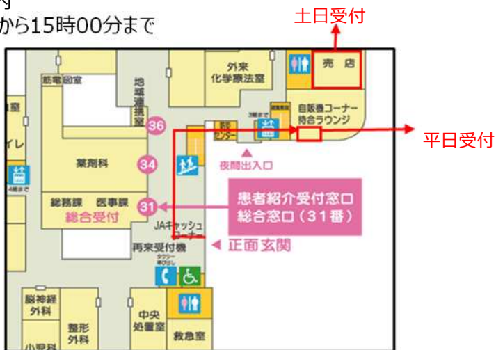
入院セット受付ブース