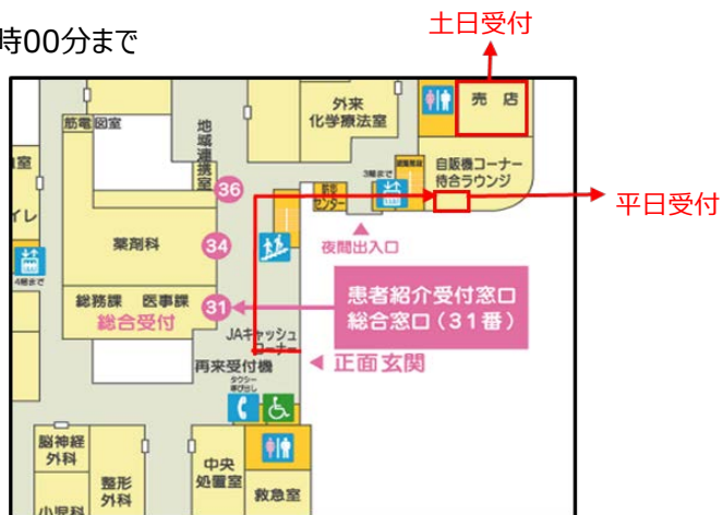
入院セット受付ブース