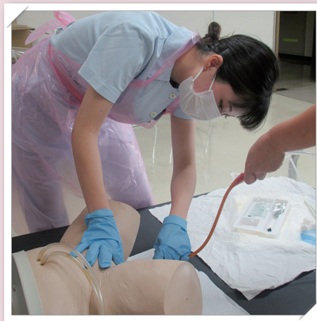
膀胱留置カテーテル挿入