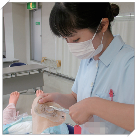
ストーマ用パウチ取り付け

就職を希望する看護職が、地域における研修協力施設など県内医療機関等で看護の知識・技術・を習得する研修を受講することで、再就業に対する不安を軽減し就職につなげるための研修です。